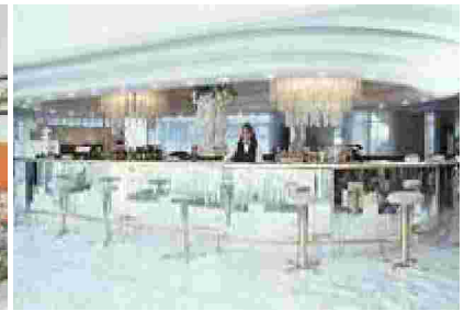
Bilder größer- öffnen in neuem Fenster